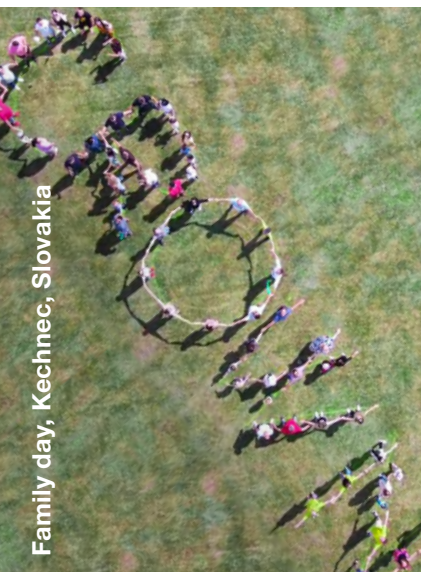
Family day, Kechinec, Slovakia

តាមរយៈក្រុមប្រតិបត្តិរបស់អ្នកផ្គត់ផ្គង់របស់យើង CROWN ធ្វើការដោយសហការជាមួយអ្នកម៉ៅការភាគី ទីបី និងអ្នកផ្គត់ផ្គង់ដើម្បីបង្ការ និងហាមឃាត់ការប្រើប្រាស់ពលកម្មកុមារក្រោមអាយុការងារស្របច្បាប់។